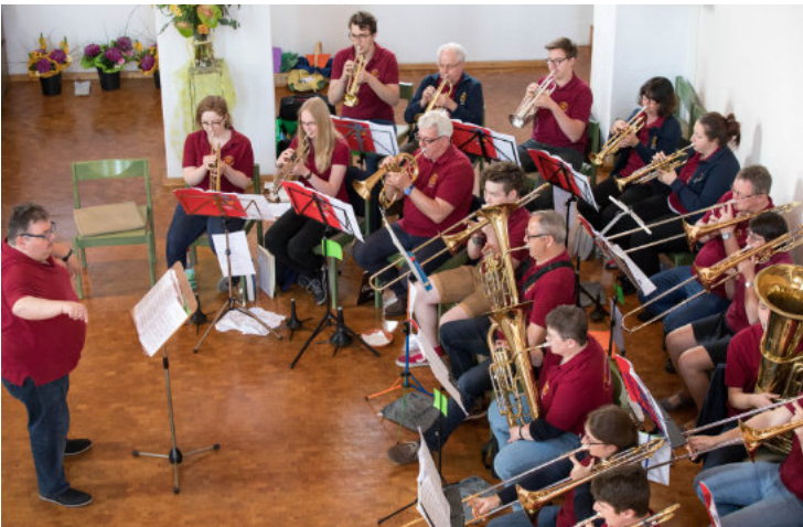
Hier der Posaunenchor St. Markus, aus dem viele auch im Bezirksposaunenchor spielen