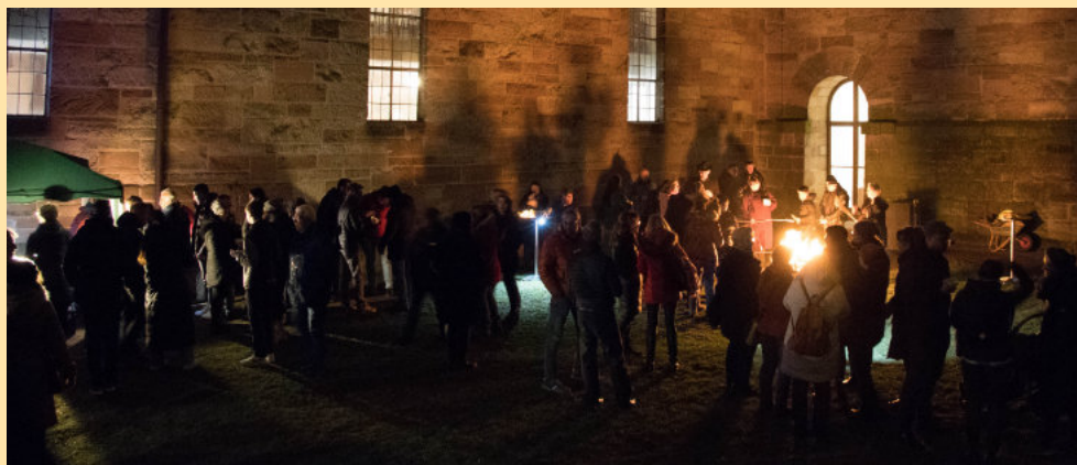
Osterfeuer nach der Osternacht