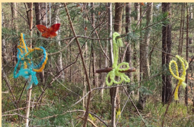
Schmetterlinge am Osterweg Steinbrüchlein: Zeichen der Auferstehung