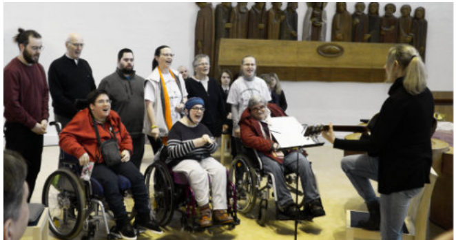
Das Ständchen des Chors des Projektpartners Integral e.V. wurde begeistert aufgenommen