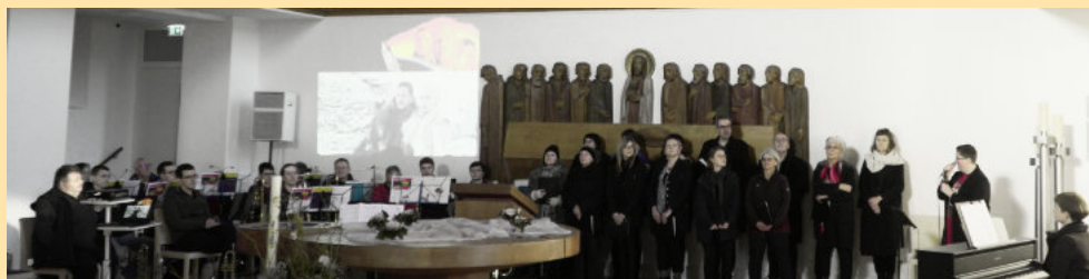
Filmmusik-Abend am 21.4.: Das Publikum freut sich auf eine Wiederholung des Konzertformats!