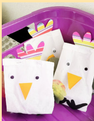
Fröhliche Ostertüten am Ostersonntag