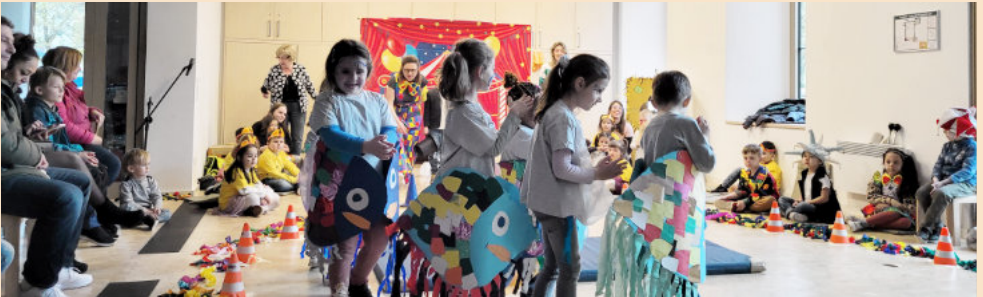
Zauberhafte Fische tanzen

Das Orchesterwerk „Karneval der Tiere“ von Camille Saint-Saëns wurde mit den Kindern erarbeitet und in Form einer Zirkusvorstellung umgesetzt. Begeistert waren die Kinder als Direktoren, Fische im Aquarium, Artistinnen, Löwen, Seiltänzerinnen und Clowns sowie mit Liedern im Einsatz und wurden mit größtem Applaus von Eltern und Gästen bedacht. Wunderbar!