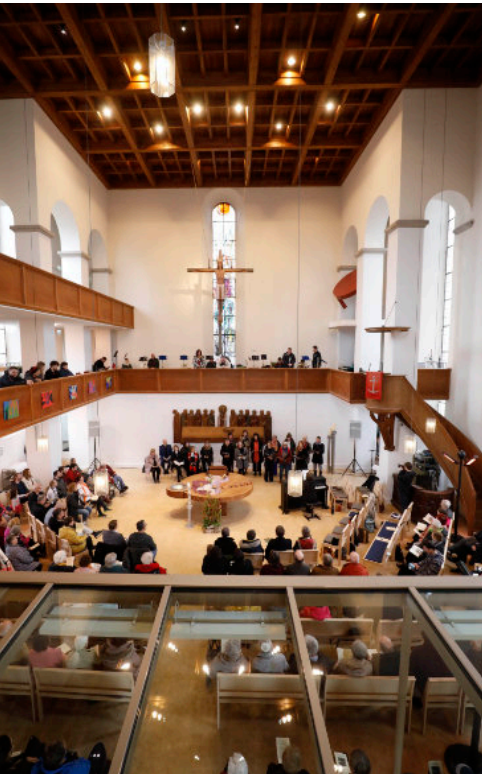
Blick von der Empore über dem FreiRaum