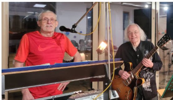
Livemusik mit „Best Age“ macht Stimmung!