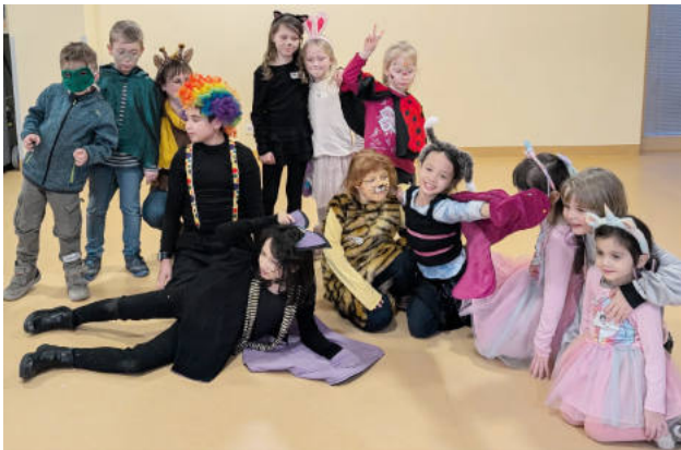
Ein Vorgeschmack auf den Himmel: Schon bei unserem Kindertag haben viele Tiere friedlich zusammengelebt.