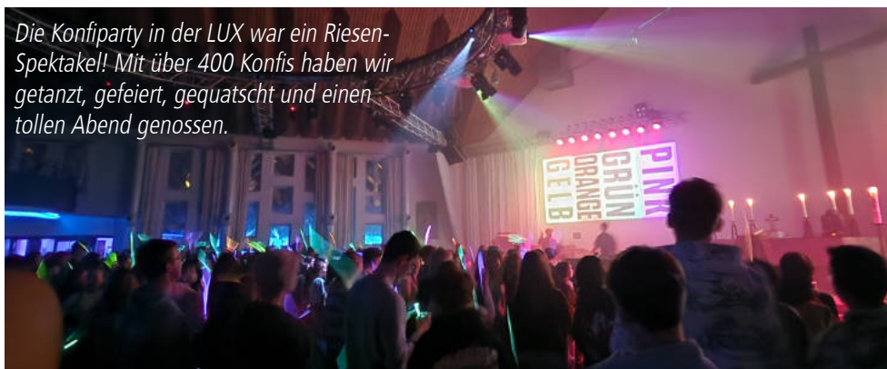
Die Konfiparty in der LUX war ein Riesenspektakel! Mit über 400 Konfis haben wir getanzt, gefeiert, gequatscht und einen tollen Abend genossen.