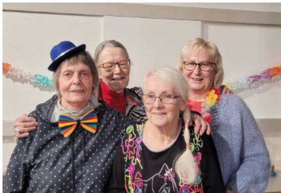
Dank an das Bunte Team