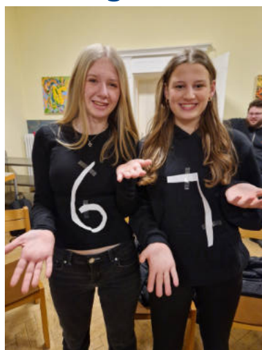
Kreative Kostüme gabs zu bestaunen bei der Malupa-Faschingsfeier. Wer checkt, der checkt! 😊