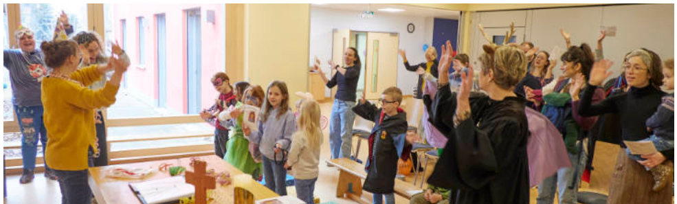
Frieden will fröhlich gelebt sein: Gottesdienst am Sonntag