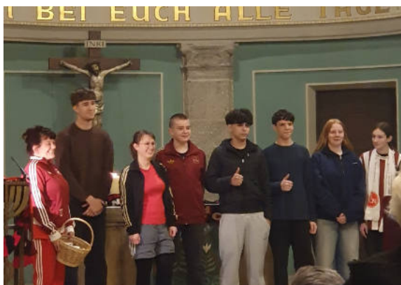
Dass der Glaube ein Teamsport ist und wir uns in der Gemeinschaft gegenseitig stärken können – darum ging es in der Dream Light Church in St. Paul.