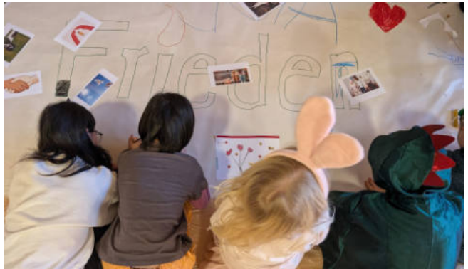
Die Kinder gestalten ein Plakat zum Thema Frieden.

In unserer Welt herrscht leider nicht immer Frieden. In den Nachrichten hören wir vom Krieg und auch in der Familie oder in Kindergarten und Schule gibt es immer wieder Streit. Am Schatzsucher-wochende fragten wir uns: Was können wir selber zum Frieden beitragen?